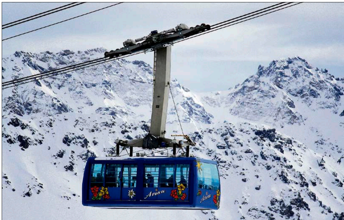
«Arosa all inclusive» besteht seit gut zehn Jahren für den Sommer. Eine Ausdehnung auf den Winter könnte nun Thema werden.

Mit Saisonschluss am 30. März 2014 ist die Klewenalp-Luftseilbahn in den Ruhestand gegangen. Seit 1972 prägte die markante Kabine den Auftritt in der Tourismusregion Klewenalp-Stockhütte. In nur zwei Monaten wird die Luftseilbahn Beckenried-Klewenalp erneuert. In gerade mal zwei Monaten müssen sämtliche geplanten Arbeiten abgeschlossen sein. Am 29. Mai wird die Anlage wieder eröffnet. Die Gondelbahn Emmetten-Stockhütte wie auch das Berggasthaus Stockhütte werden planmässig am 14. Mai den Sommerbetrieb aufnehmen. dst