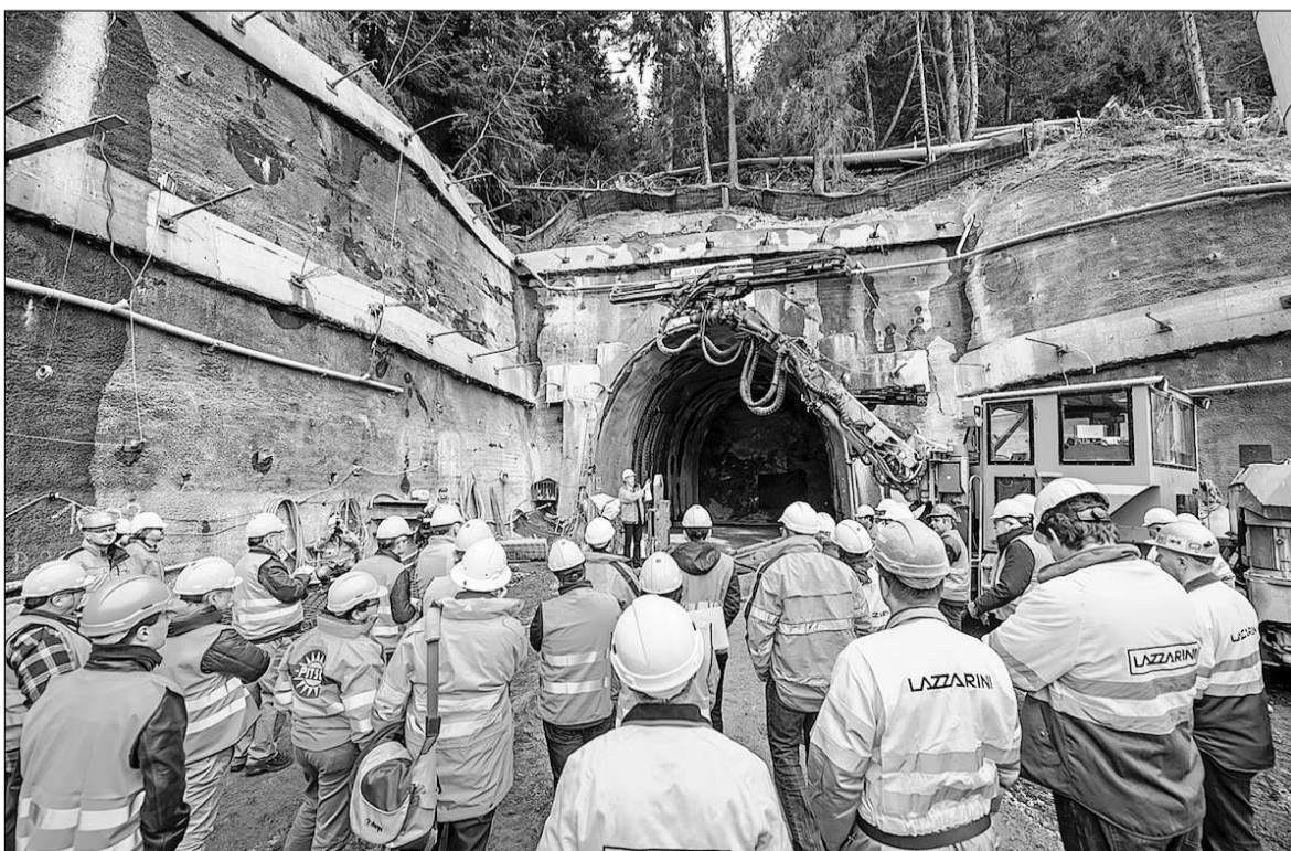
Die Bauarbeiten im Berg können beginnen: Gestern wurde die erste Sprengung für den Plattas-Tunnel vorgenommen.

Die neue Strasse zweigt laut einer Mitteilung von der Feldiserstrasse ab und führt mit lediglich zwei Haarnadelkurven zur Geländeterrasse von Trans, wo sie in die alte Kantonsstrasse einmündet. Die alte Transerstrasse wird nach Inbetriebnahme der neuen Strassenverbindung ins Eigentum der Territorialgemeinden Tomils und Paspels übergehen. Sie wird als Wald- und Meliorationserschliessung dienen. (bt)