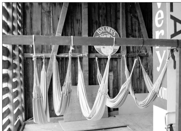
Die Hängematten im «Balmer's» sind für Gäste mit Jetlag – oder einem tüchtigen Kater – vorgesehen.

Dass die Bar innerhalb des «Balmer's» zum Anziehungspunkt für junge Gäste und Einheimische geworden ist, weiss auch die Konkurrenz. Und sie weiss damit umzugehen: «Party at 'Balmer's', sleep at 'Backpackers Villa'».