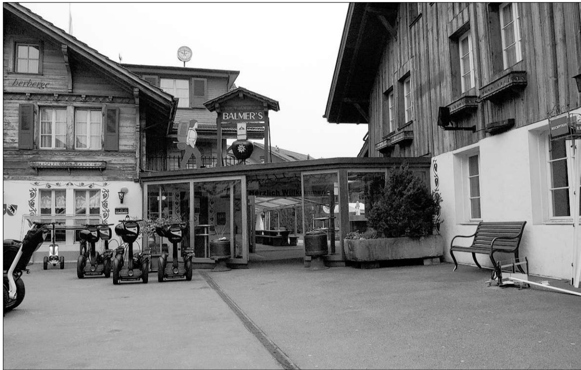
Urchiges für Junge aus aller Welt: Die Herberge «Balmer's» ist Anziehungspunkt für Backpacker aus unterschiedlichsten Ländern.

Die einzelnen Herbergen haben innerhalb des Vereins eine klare Positionierung. Bühlers Hostel