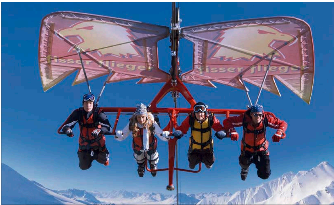
Seit Jahren ein Überflieger: Die Destination Serfaus-Fiss-Ladis (Tirol) mit ihrem Fisser Flieger.

Serfaus führt Ranking trotz tiefem Marketingbudget an Das Tiroler Tourismusgesetz ermöglicht es den Forschern, die effektiven Zahlen der Destinationen zu ermitteln und ein Ranking zu erstellen. Nur jede zweite Destination im Tirol weist ein reales Wachstum aus. Serfaus-Fiss-Ladis, das voll auf Kinder und Familien setzt, hat die Nase vorn. Die Destination weist seit Langem ein