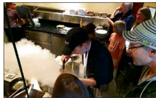
Zählte zu den Hauptattraktionen in den Betrieben: die Hotelküche .