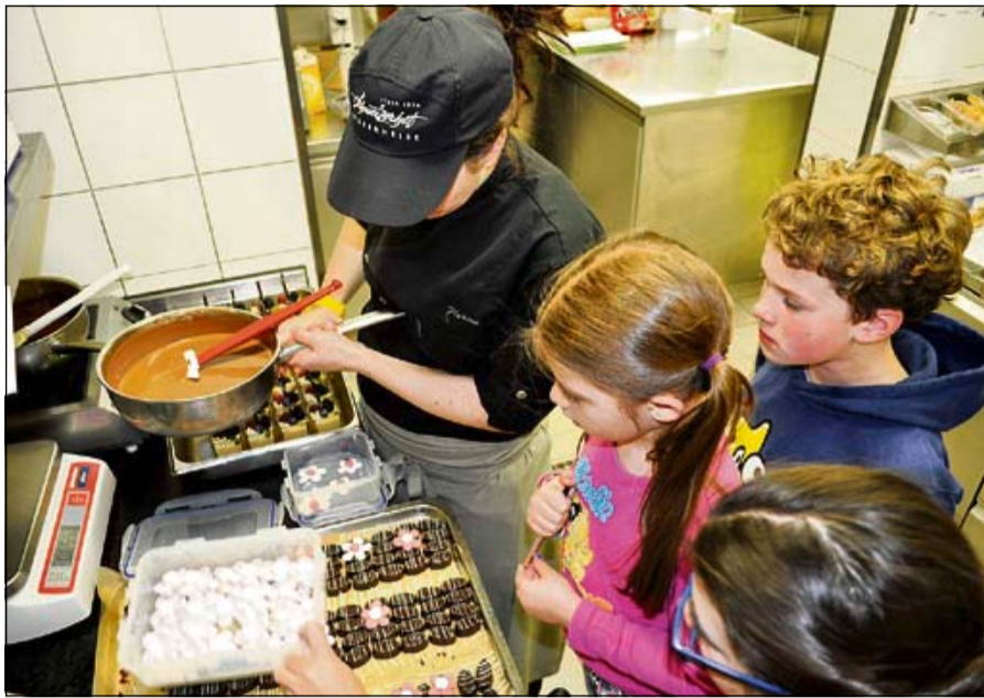
Für grosse Geniesser und kleine Hobbyköche: Der erste in allen Landesteilen durchgeführte Tag der geöffneten Hoteltüren stiess auf grosses Interesse.