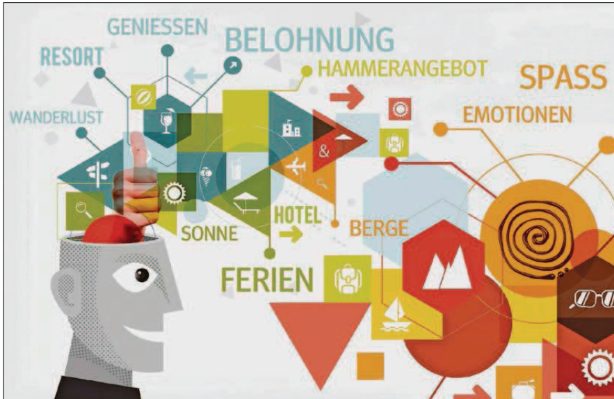
Die Entscheide im Hirn basieren auf Emotionen. Um den Kunden positiv zu beeinflussen, müssen diese positiver Natur sein. Belohnungen sind dem Hirn für seine Leistung wichtig. Denn es denkt nicht gerne freiwillig.

«Immer, wenn es darum geht, Kunden zu gewinnen, Kunden zu begeistern oder Kunden anzubinden, dann sind wir schon mitdrin in der Hirnforschung», sagt der Neuromarketing-Experte Häusel. Die Ergebnisse der Hirn-