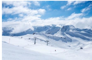
Wolkenspiel über dem Schneck Oberstdorf