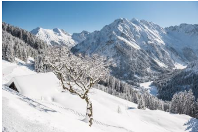
Kleinwalsertal im Winter

Informationen und alles Wissenswerte unter www.tourismusforum.ch