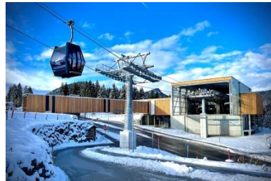
Talstation Söllereckbahn Oberstdorf