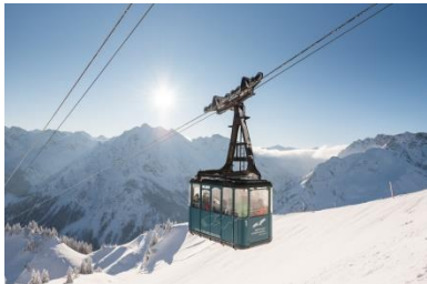
Walmendingerhornbahn Kleinwalsertal